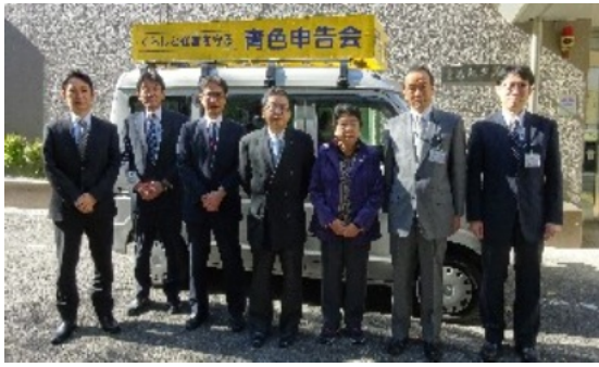
大木豊島税務署長も激励

今年も両部の役員が組になり、PRテープを流しながら区内全域を回り、側面から会員増強運動を支援しました。会員さんの協力が、会活動の大きな支えとなっておりますので今後ともよろしくお願いいたします。