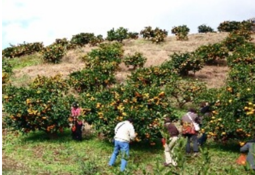
みかん狩りを満喫しました

研修後、伊東のうさみ農園でみかん狩りを楽しんだ後、伊東温泉ホテル聚楽で昼食と温泉を満喫しました。その後、ひものセンターに立寄り池袋に帰りました。